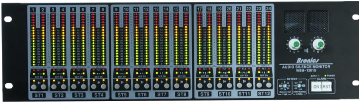
WSM-1201SN Audio Silence Monitor