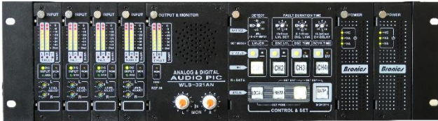
WLS-321AN (4CH) Analog & Digital Audio PIC