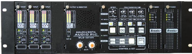
WLS-321AN (3CH) Analog & Digital Audio PIC