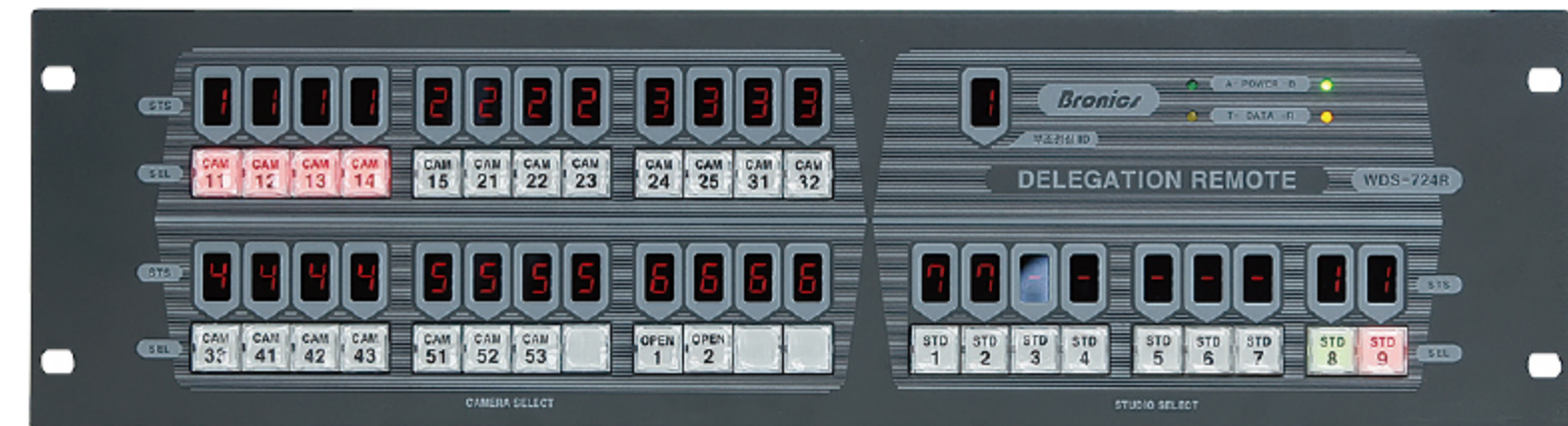
WDS-724R Delegation Remote

본 장비는 다수의 스튜디오 및 카메라, 부조정실로 구성된 방송국의 부조정실에서 임의의 스튜디오와 카메라를 선택하여 프로그램을 제작할 때 사용하는 장비로서, 리모트의 버튼 조작만으로 각종 VIDEO 신호와 TALLY, INTERCOM, 스튜디오 확정신호 등을 자동으로 연결 시켜주는 시스템 장비이다.