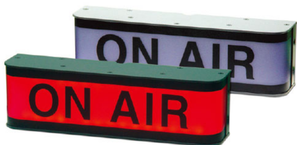
WOL-100 ON AIR LAMP (RED 1 COLOR)