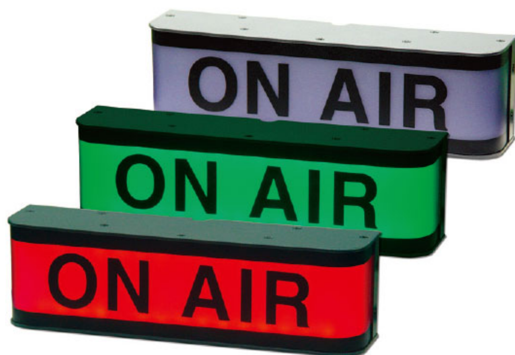
WOL-100D ON AIR LAMP (2 COLOR)