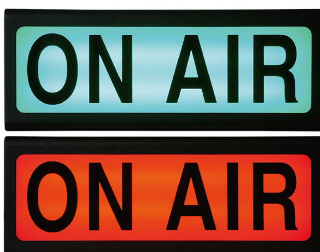
WOL-300 ON AIR LAMP (2 COLOR)