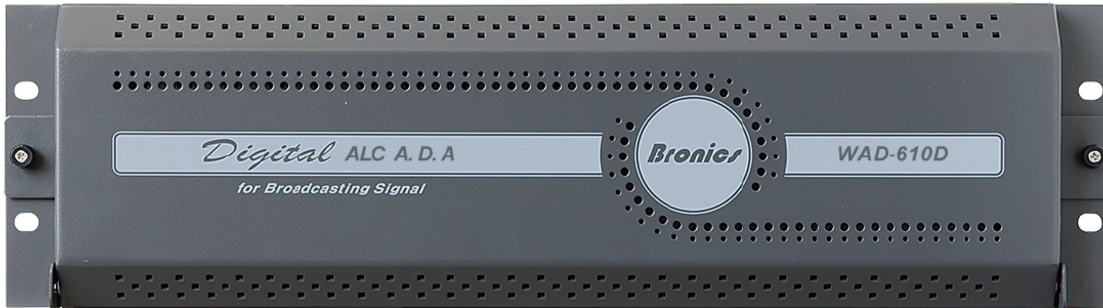
WAD-610D ALC A.D.A. (Digital)

사용자가 선택한 각 설정 SW 값에 따라 자동으로 Gain을 조정해 주는 ALC(Automatic Level Control) 기능을 보유한 Audio 분배기로서, Audio Level 변동이 심한 신호의 출력 Level을 자동으로 일정하게 유지시켜 주기 위하여 사용하는 장비이다. 입력신호와 출력신호는 모두 Balance 방식으로 구성되어 있으며, 1 개의 입력신호는 6개의 출력신호로 분배된다.